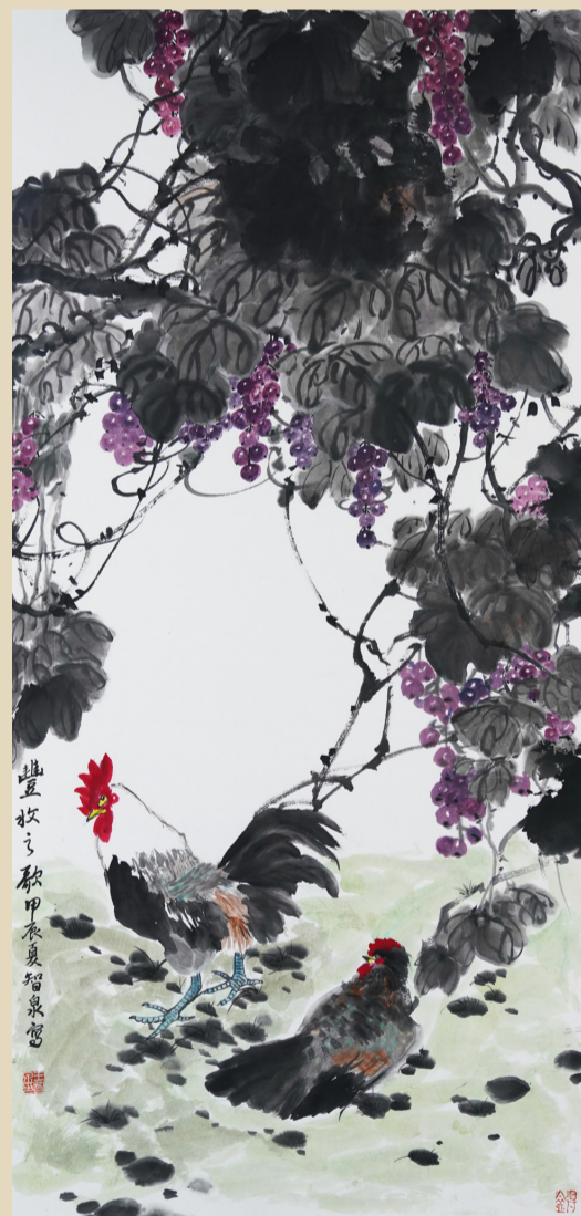
《丰收之歌》 王智泉 滨州市沾化区人民法院