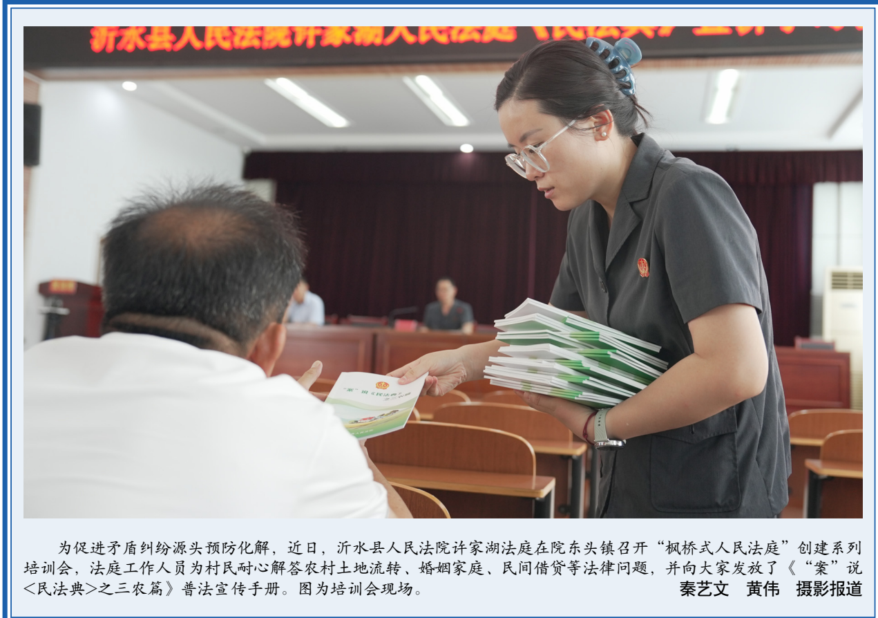
为促进矛盾纠纷源头预防化解，近日，沂水县人民法院许家湖法庭在院东头镇召开“枫桥式人民法庭”创建系列培训会，法庭工作人员为村民耐心解答农村土地流转、婚姻家庭、民间借贷等法律问题，并向大家发放了《“案”说民法典》之三农篇普法宣传手册。图为培训会现场。