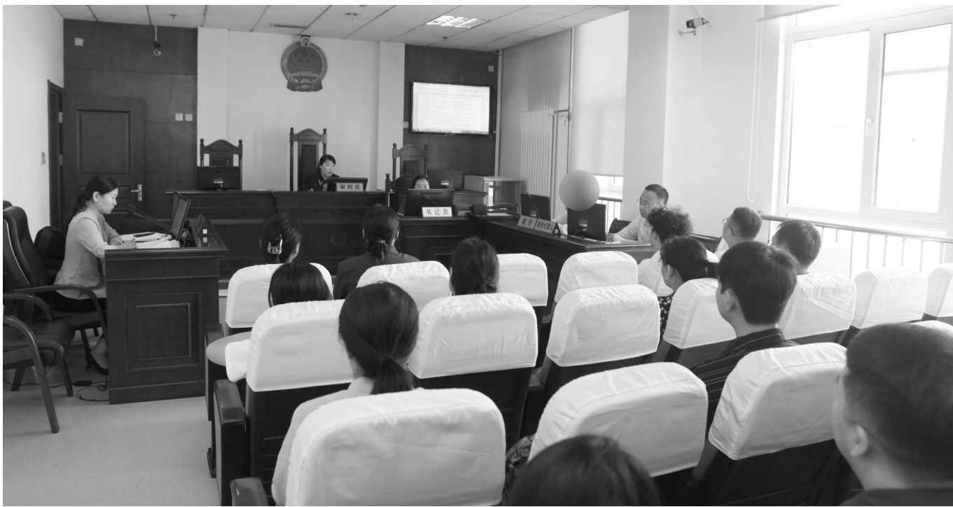
为进一步强化涉未成年人审判工作，增强未成年人保护工作合力，近日，青岛市李沧区人民法院对一起涉未成年人生命权、身体权、健康权纠纷案件开展庭审观摩活动，邀请相关人员现场旁听庭审，零距离感受法院工作。旁听人员纷纷表示，通过本次旁听庭审活动，学习到了相关法律知识，对如何增强未成年人保护有了新的认识。图为庭审现场。