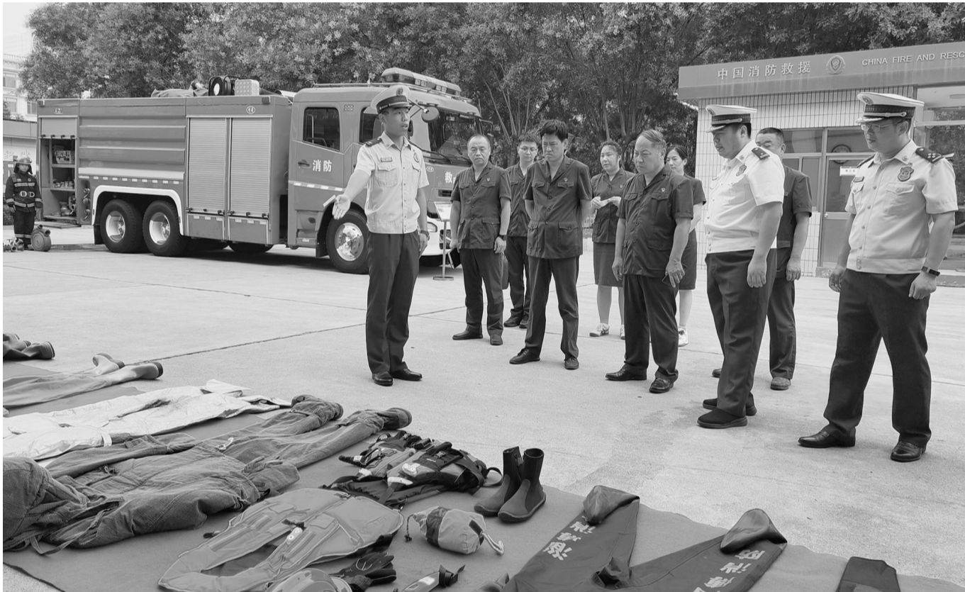
7月12日，淄博市临淄区人民法院机关第五党支部与临淄区雪宫消防救援站开展党建共建活动。法院干警详细了解了消防救援设备类别和性能，观摩了消防队员技能科目训练和灭火救援操作演练，随后，又结合自身审判工作实践，为消防队员们讲授了一堂普法宣传课。图为活动现场。崔婷婷 摄

在这里，当游客发生纠纷时，可第一时间寻求解纷“良方”。好运角法庭对于矛盾纠纷，就地调解，就地裁决，为游客提供暖心法治服务，以司法之力护航游客旅途安